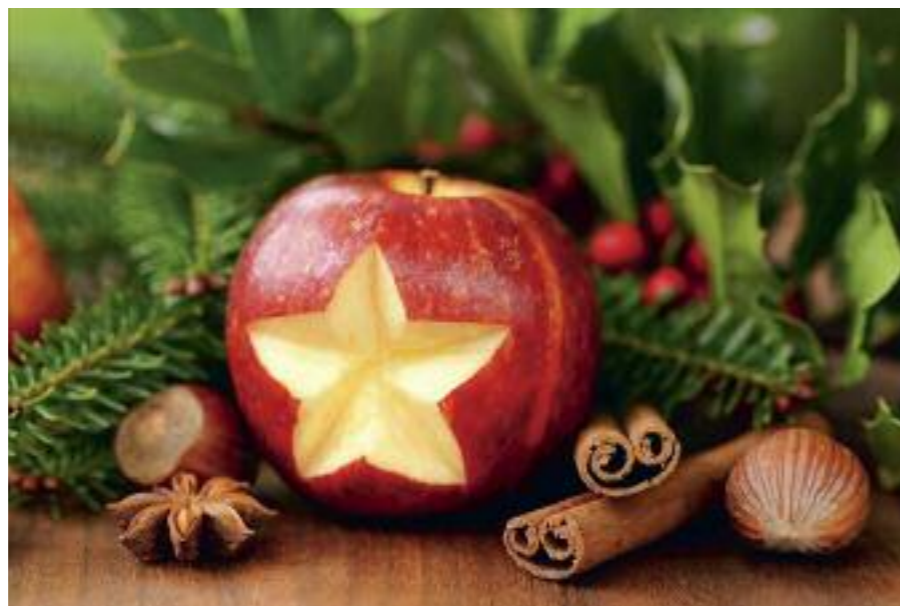
Moderní pojetí, jak docílit hvězdy na jablku.

Ačkoli má Štědrovečerní večere u mnohých postní charakter, vrcholem Vánoc je půlnoční mše (pozůstatek nočních vigilií, které předcházely oslavě