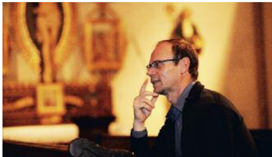
Smyslem Vánoc je připomenutí toho, že se narodil Ježíš Kristus.

„Posláním mše v období adventu je připravovat se na Vánoce, tyto bohoslužby neobsahují žádné zpěvy vánočních písní, ale především jsou výzvou k přemítání o sobě samém. U nás ve farnosti u sv. Prokopa máme navíc v období adventu jednu zvláštnost. Jedná se o rořátní mše u sv. Rocha, které jsou specifické tím, že se pořádají v 6 hodin ráno. Letos se budou v době adventu konat každou středu. Vánoční mše, která je nejkrásnější a nejsilnější, se pak slouží o půlnoci, kdy začíná 25. prosinec, rozezní se zvony