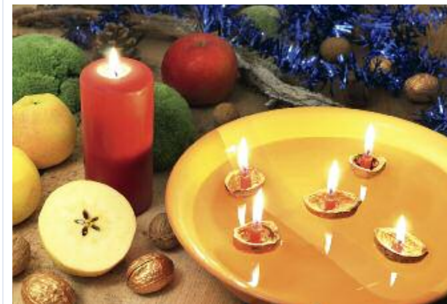
Pouštění skořápek je starým pohanským zvykem.

O původu oslav jste si jistě názor udělali... Ale, jak tomu bylo v Čechách? Zde má totiž nynější slavení Vánoc jasně křesťanské rysy. Přípravu na samotné vánoce představuje období 4 týdnů před nimi, tzv. advent. Jeho první neděle pak označuje počátek křesťanského roku. Nicméně označení jednotlivých neděl (železná, bronzová, stříbrná a zlatá) má pouze komerční charakter. Z křesťanského pohledu advent zahrnuje jednak oslavy svátků mnoha svatých (Ondřej, Barbora, Mikuláš či