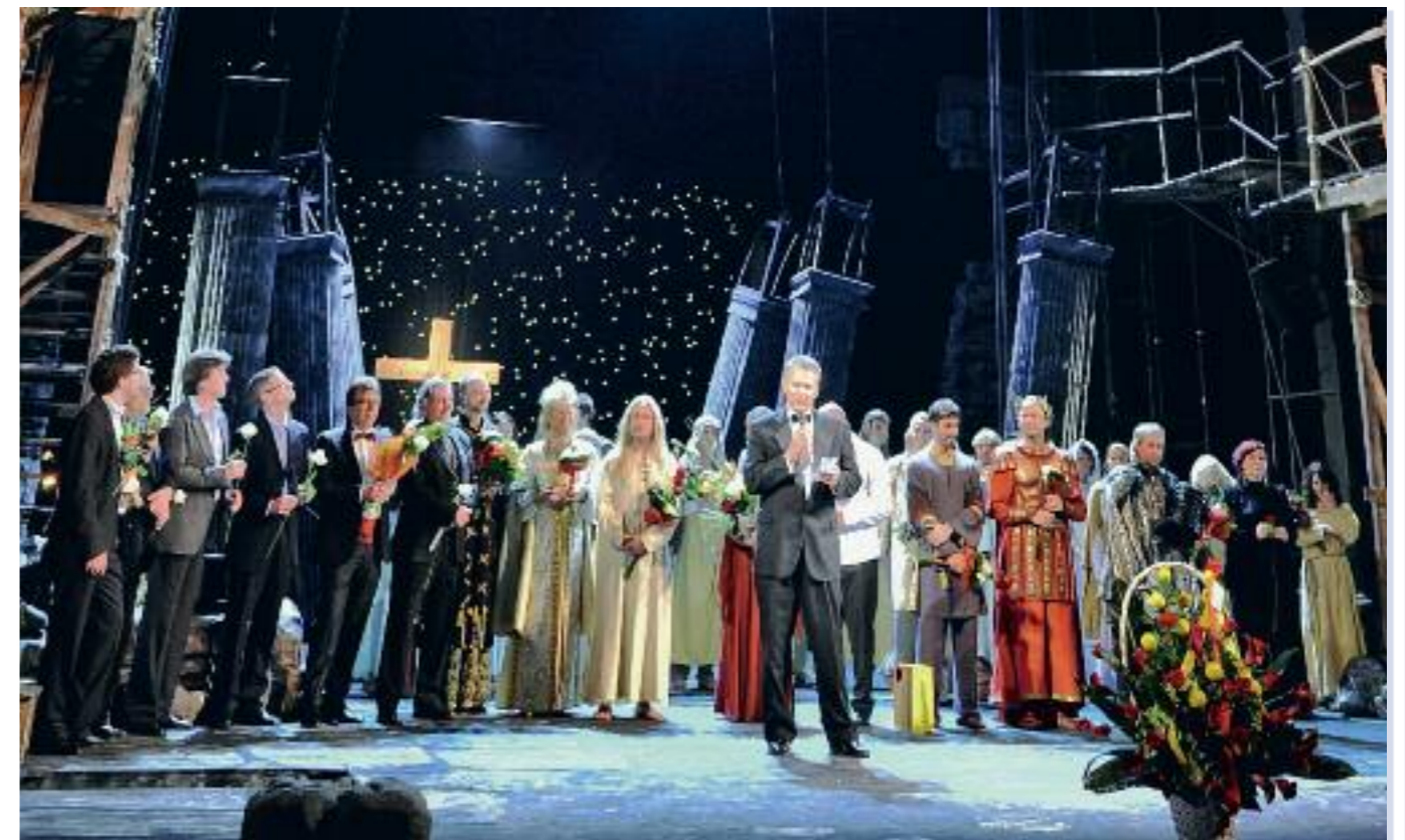
Premiéra muzikálu Jesus Christ Superstar v Hudebním divadle Karlín proběhla 11. listopadu 2010 před naprosto vyprodaným hledištěm.

Plánů mám spoustu, nicméně nerad bych něco zakřiknul nebo říkal dopředu. Jediné, co vím na sto procent, je, že neošidím ani rocková pódia ani divadelní prkna a budu se snažit si to užívat jako doteď. Pokud zdraví dovolí, chci hrát co nejčastěji – ať už tam nebo tam. ■