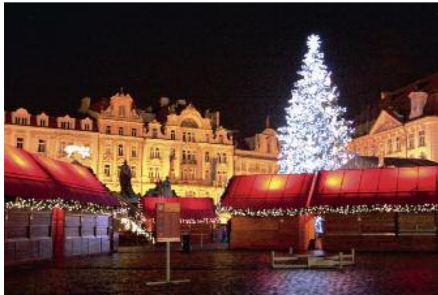
Staroměstské náměstí a okouzující atmosféra Vánoc v Praze.