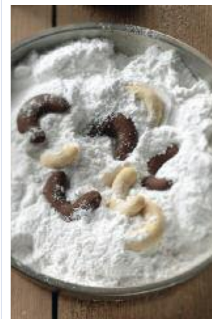
Vanilkové rohlíčky, sladká delikatesa.

Vodu s cukrem uvaříme na sirup, do vychlazeného sirupu přidáme kokos, sušené mléko, změkklý tuk, rozdrčené piškoty a vypracujeme těsto, z kterého formujeme kuličky (ruce si občas namočíme ve studené vodě). Doprostrřed dáme oříšek, obalíme v kokosu a ukládáme do papírových košíčků.