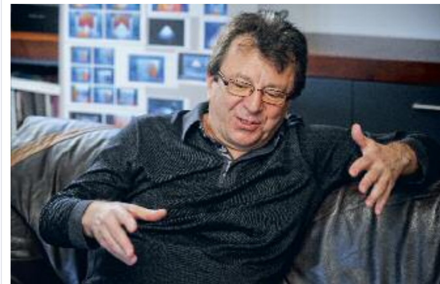
Karlín v žádném případě nechtěl přenášet spirálovského Ježíše, chtěl vytvořit zcela novou inscenaci.

Dneska s odstupem času všichni víme, že si jen chtěli vyzkoušet, jestli to doká-