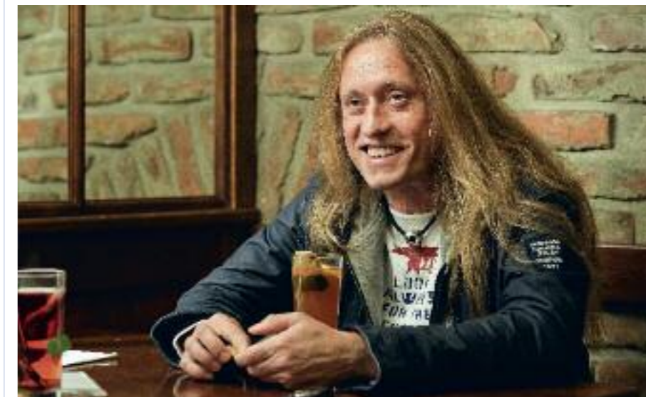
Mám rád scénu, ve které Jidáš zradí Ježíše.

nešel s tím, že bychom o něčem takovém přemýšleli. Byly to čtyři roky, kdy jsme s Jesus Christ Superstar skutečně všichni intenzivně žili, sešla se tam česká rocková interpretační i hudební špička. V těch letech jsme byli takovou uzavřenou komunitou, která si žila svým vlastním životem, svým vlastním příběhem.