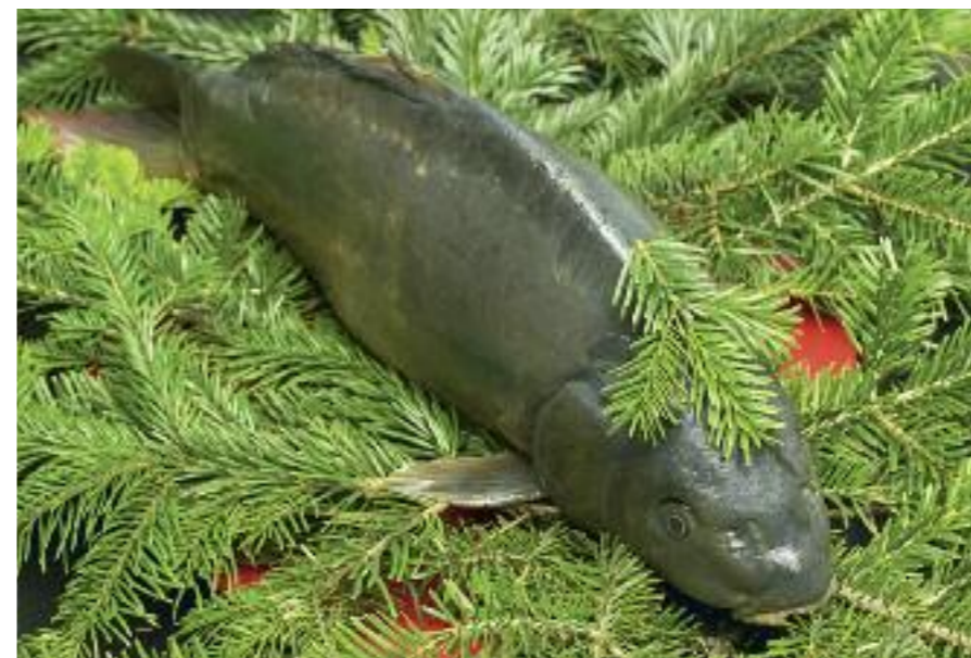
Ani kapr není původním vánočním jídlem.

Symbolika byla tedy jasná, stromky měly ochrannou funkci a ozdobné větve nosili a rozdávali i koledníci. Stromek ale původně nestál, jak jej známe dnes. Visel od stropu špičkou dolů, což mělo symbolizovat Nejsvětější Trojici