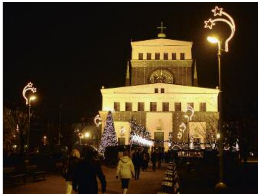
Dnes již tradiční předvánoční pohled na náměstí Jiřího z Poděbrad.

V řadě zemí za hranicemi českých luhů a hájů jsou oslavy podobné, jako u nás. Naproti tomu v těch částech světa, kde nad křesťanstvím převládá v populaci jiné náboženství nebo kulturní vlivy, se oslavy odehrávají jinou formou, či dokonce k jinému datu. Ovšem jejich kompletní výčet a popis by vydal na samostatnou knihu.