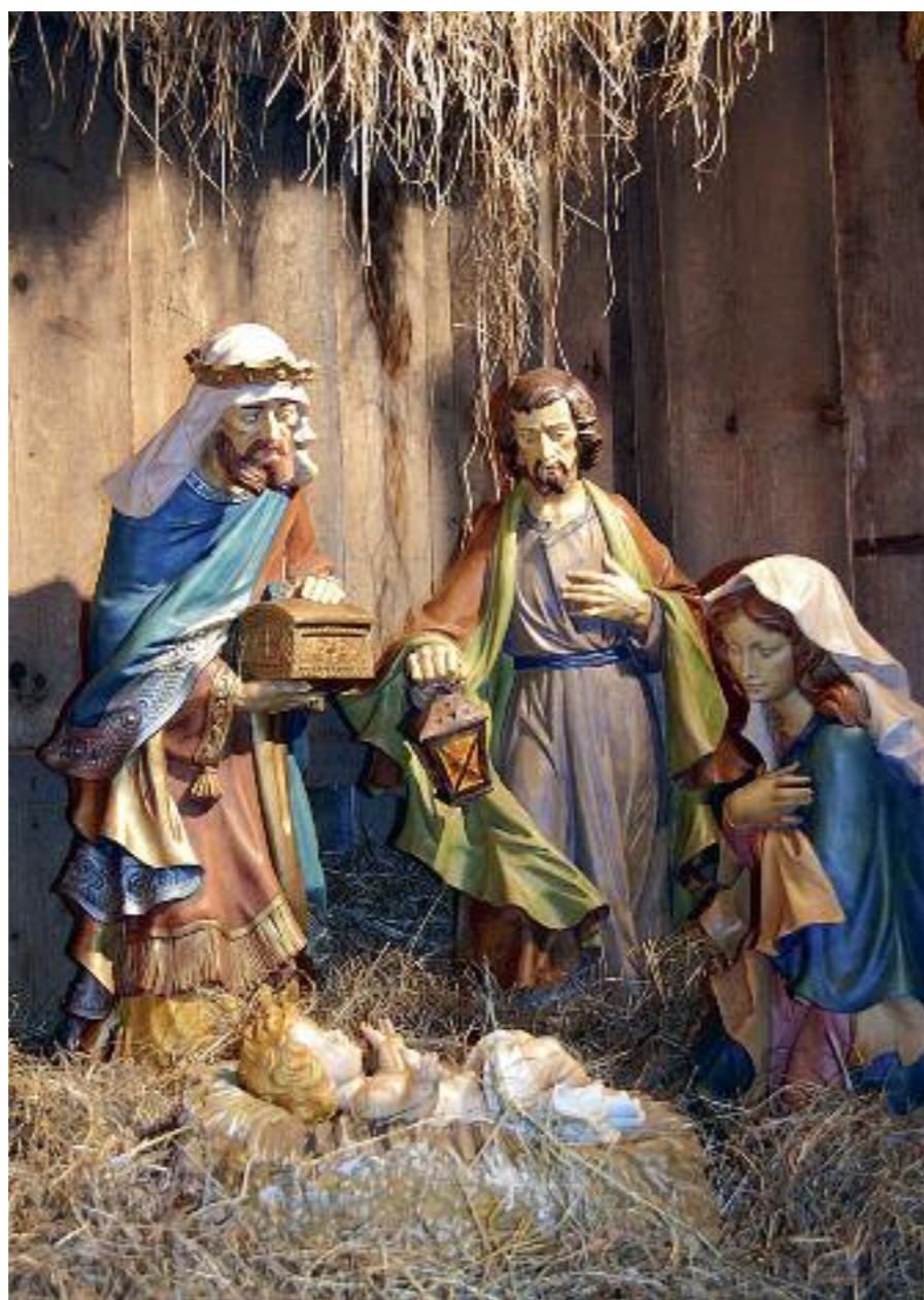
Rodinný betlém se v Itálii dědí z generace na generaci.

Jak vidíte, tyto zvyky byly velmi spojeny s věštěním budoucnosti, což dokládá i řada literárních děl. A důvod? Víme snad všichni, co nám krom Narození Páně přinese příští rok?