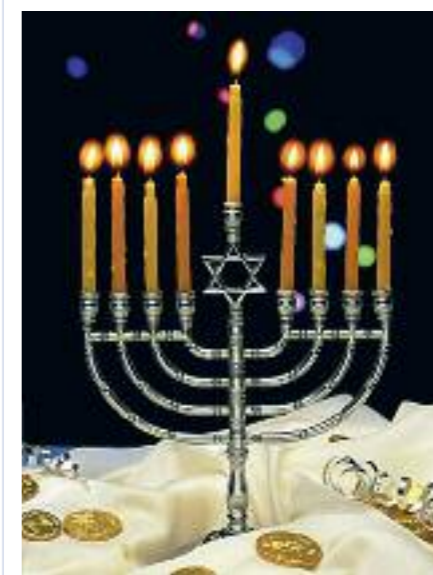
Jedna z mnoha podob chanukového svícnu.

Chanukia, tedy chanukový svícen, má celkem osm ramen. Deváté bývá oddělené (mimo rovinu ostatních) a slouží jako symbolický pomocník – sluha, neboli „šamaš“, jehož prostřednictvím se svíce zapalují. První den Chanuky se zapaluje první svíce, druhý se přidá další až v zá-