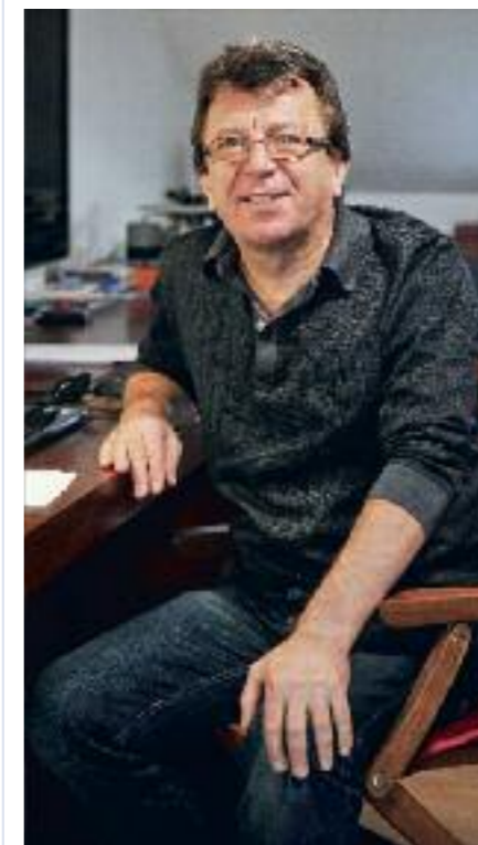
Miluju hudbu A. L. Webera od samotného počátku.

Tenkrát jsem v kavárně Alfa objevil jistou skupinu, která se jmenovala Juventus s naprosto fantasticky zpívajícím Karlem Černochem. Dohodli jsme se, že půjdou do studia, jenže oni neměli vlastní tvorbu, reprodukovali jen cizí písně. Dva songy se tedy zadaly nějakému renomovanému textaři a ten asi čtyři dny před natáčením prohlásil, že to nezvládá... Takže byly dvě možnosti: buď písničky napsat sami, nebo přeložit natáčení, což by bylo minimálně o čtvrt roku. Tenkrát byla v Praze dvě studia, takže se zkrátka čekalo. Už ani nevím,