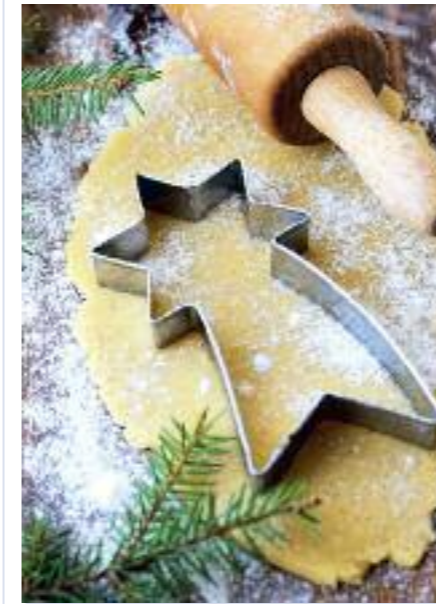
Kometa je jedním ze symbolů Vánoc.

Oblíbený farmářský trh, který je od září neoddelitelnou součástí dění na náměstí Jiřího z Poděbrad, se během prosince promění na vánoční farmářský trh a až do 23. prosince bude otevřený denně, rovněž od 10 do 19 hodin. Naleznete zde směs kvalitních