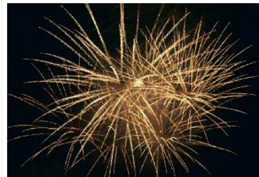
Dokážete si bez ohňostroje představit konec roku?

Novodobé oslavy konce starého a začátku nového roku mají svojí formou pramálo společného s původními tradicemi křesťanství, ale také jiných náboženství a kultur. Veselí, odehrávající se ve znamení dobrého jídla a pití, zábavy a ohňostrojí, jak jej známe dnes, se v křesťanských zemích každoročně odehrává až od začátku 19. století. Je to